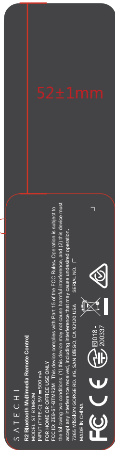
(Label location: back side of the device)