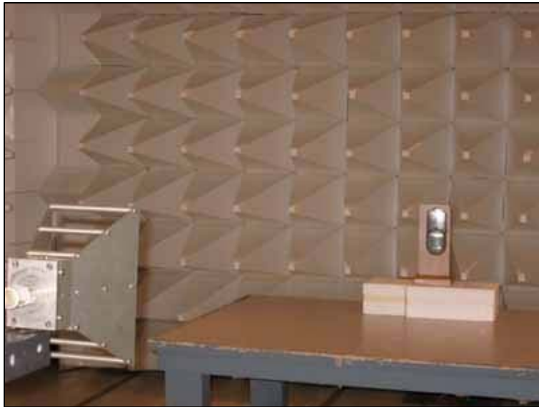
Occupied Bandwidth 1-18GHz