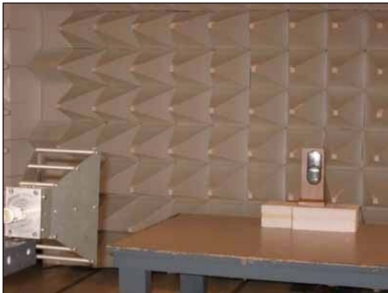
Band Edge 1-18GHz