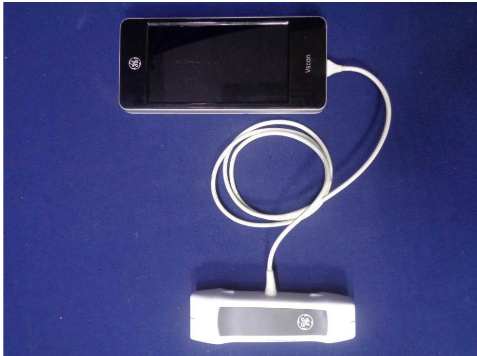
EUT Front View