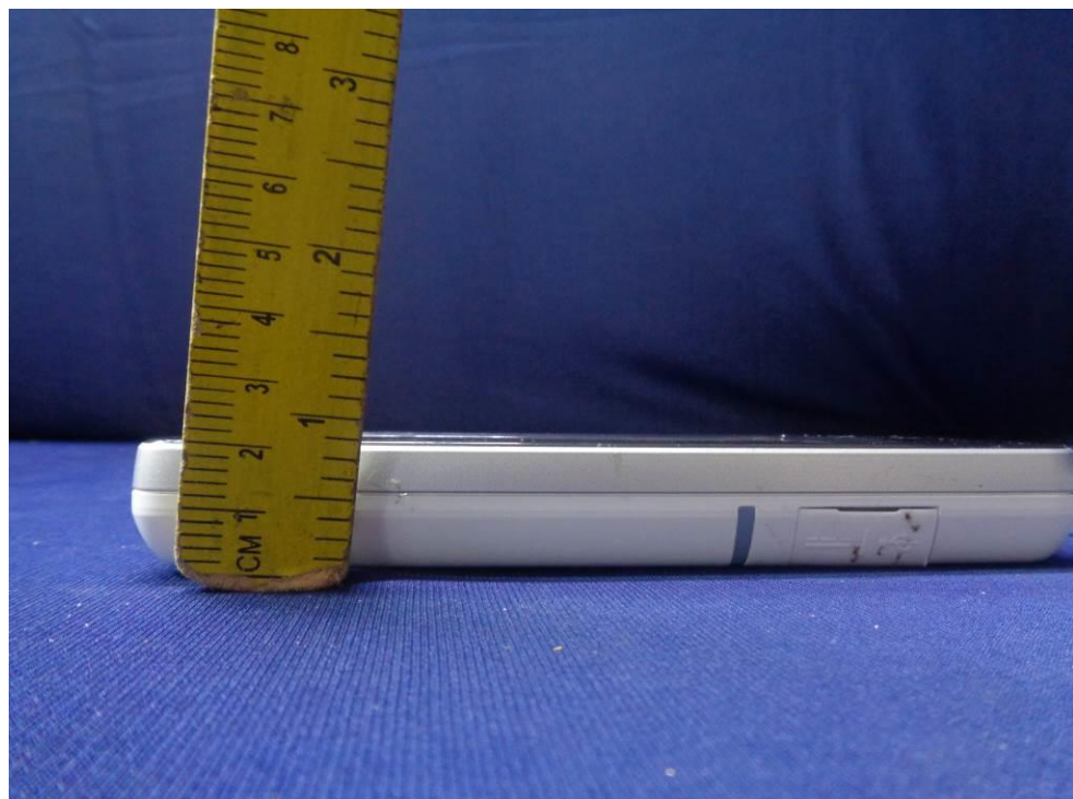
Phone Dimensional View