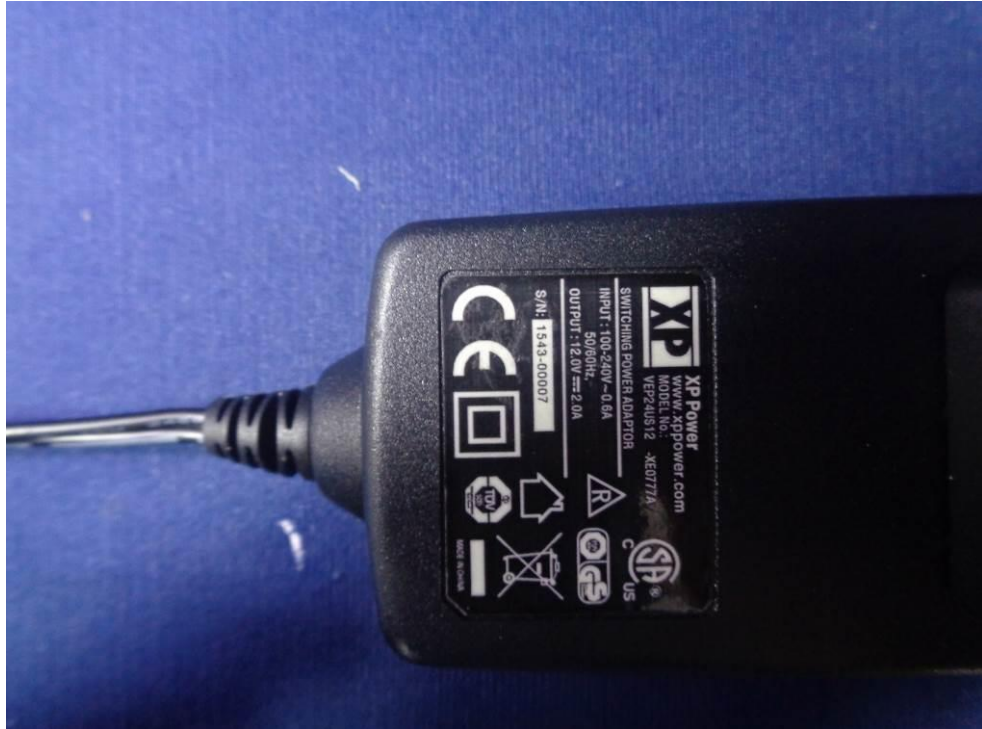
Power adaptor View