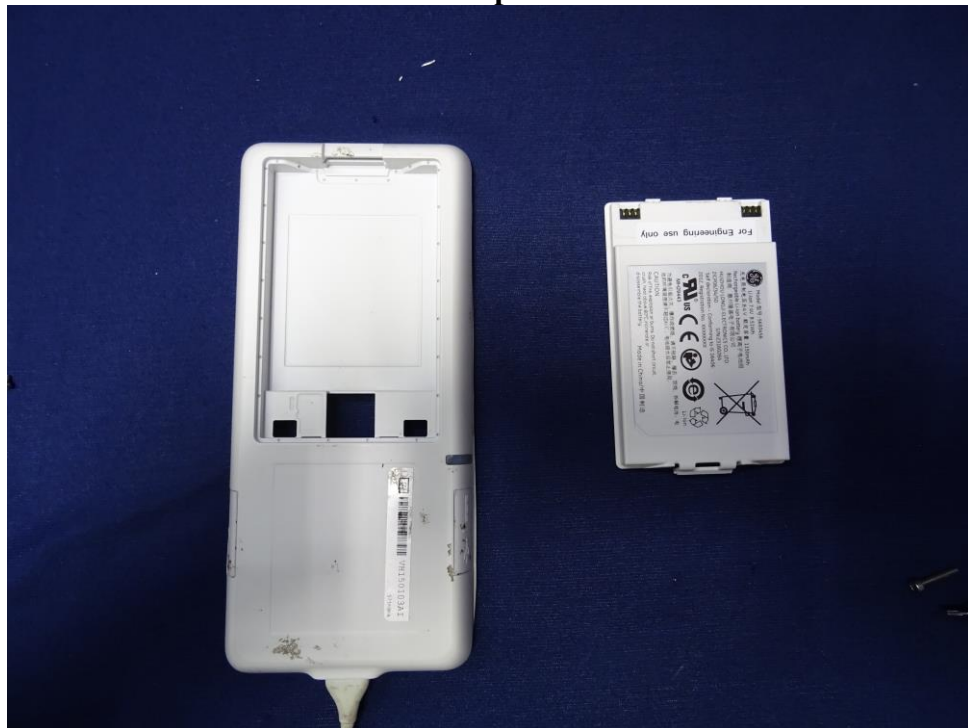
EUT and Battery