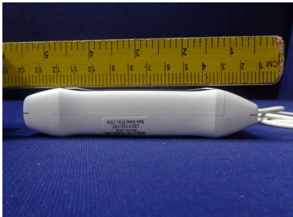
Probe Dimensional View