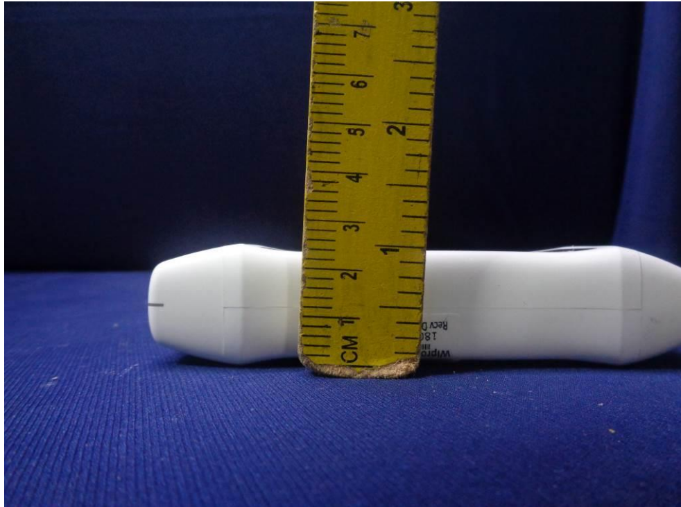
Probe Dimensional View