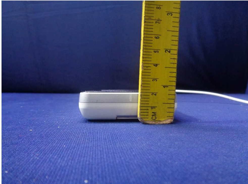
Phone Dimensional View