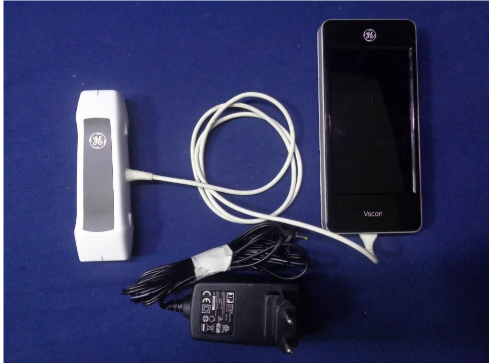
EUT Over all View