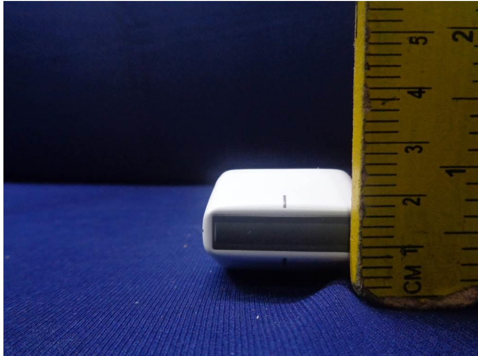
Probe Dimensional View