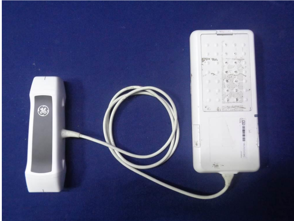
EUT Back view