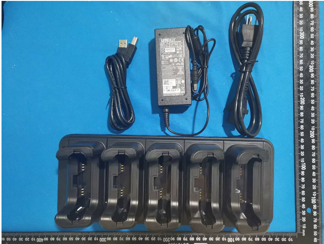
EXHIBIT B - EUT EXTERNAL PHOTOGRAPHS