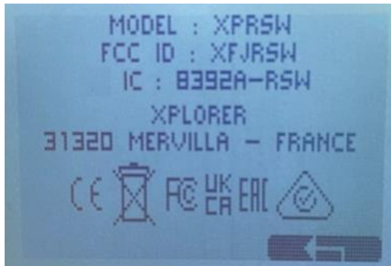
E-Labeling : compliance information