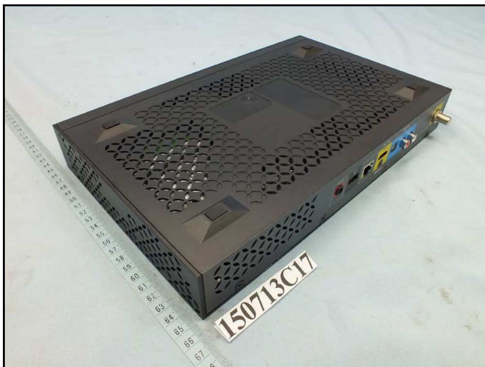
Model Name: Spectrum100-C