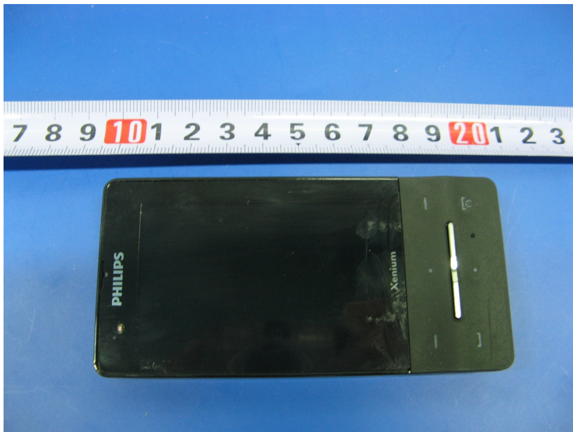
VQRCTX810 external photo