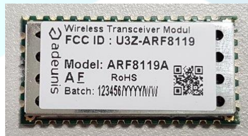
Sample Label and Label Location Model ARF8119A