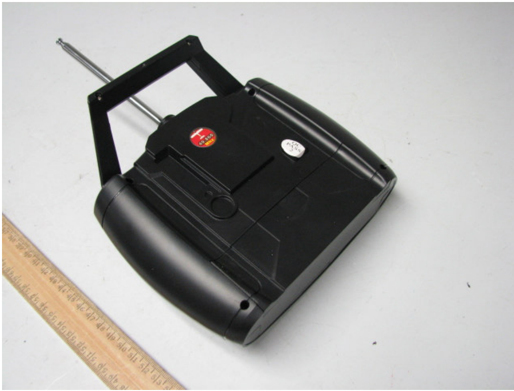
Transmitter (External view)