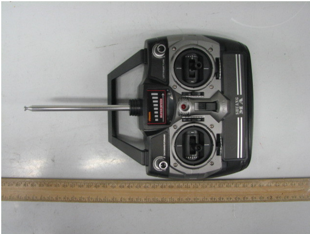
Transmitter (External view)