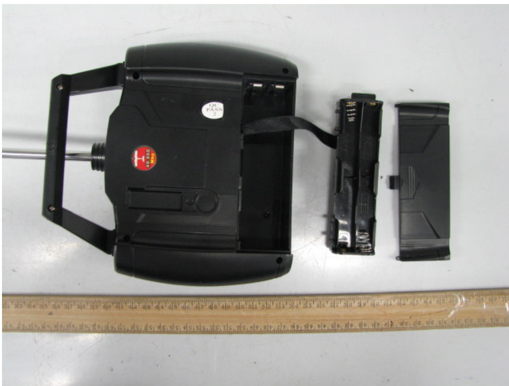
Transmitter (External view)