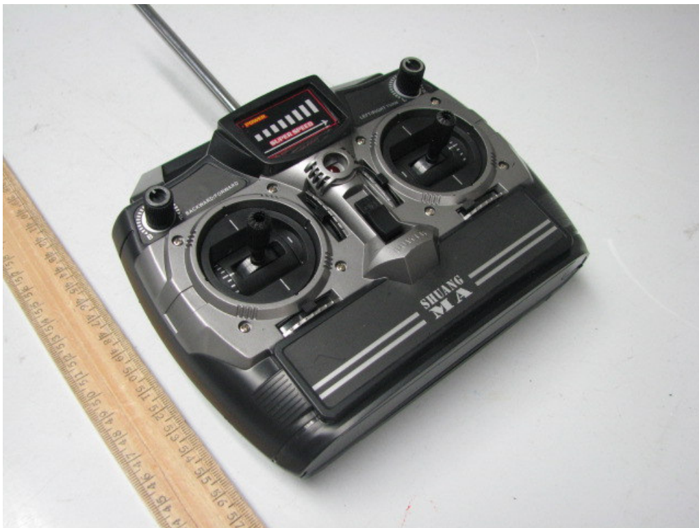
Transmitter (External view)