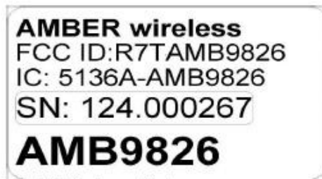
Label V1 4-fach vergrößert