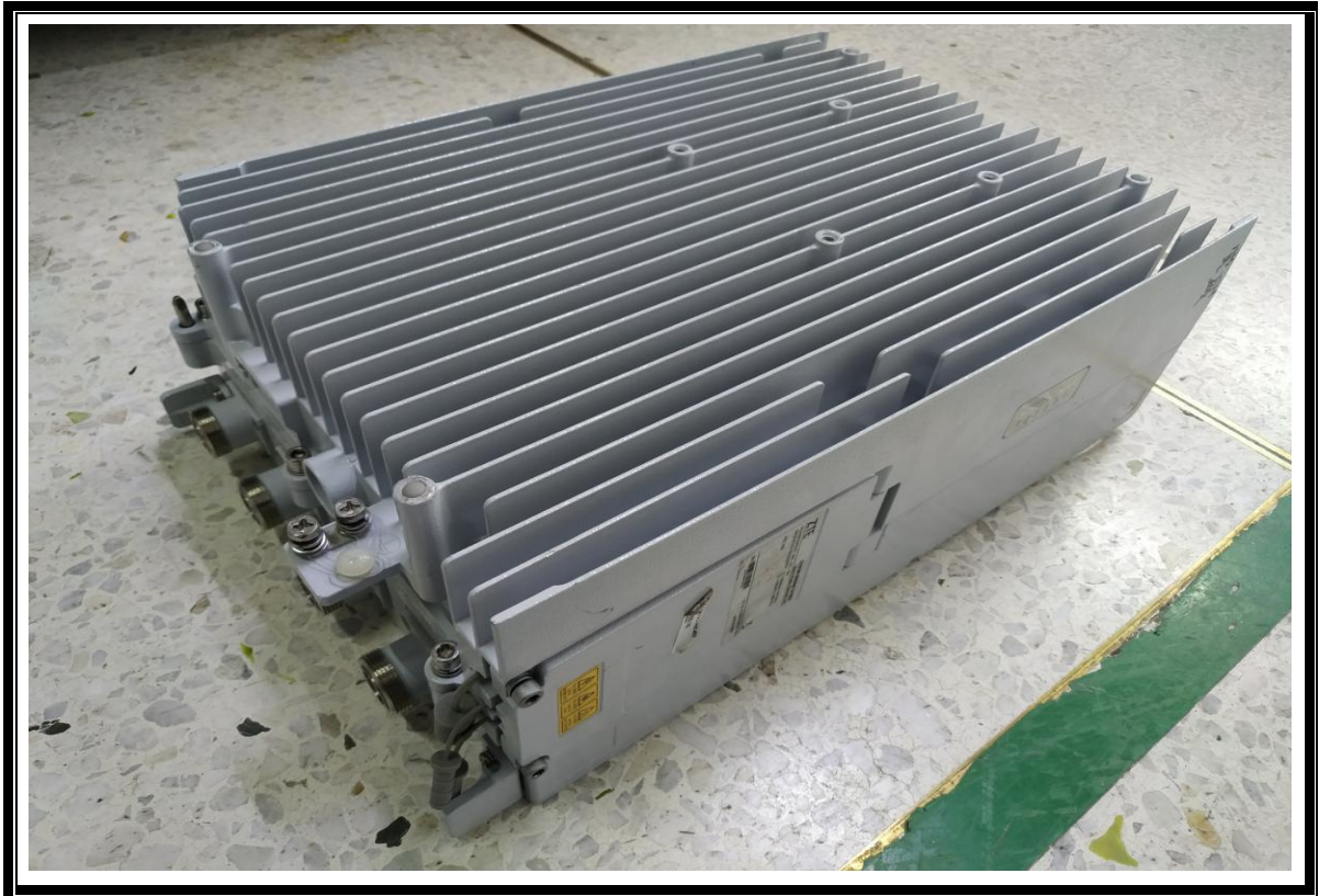
L*W*H=415mm(L) X 294mm(W) X 145mm(H)