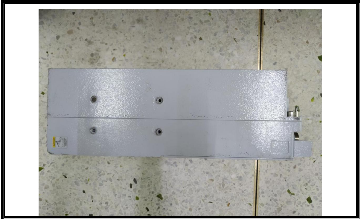
侧面照（含发射口、接口等部位）