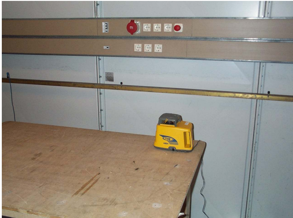
Bild 1. Funkstörspannung am Netzanschluss [conducted noise at mains ports]