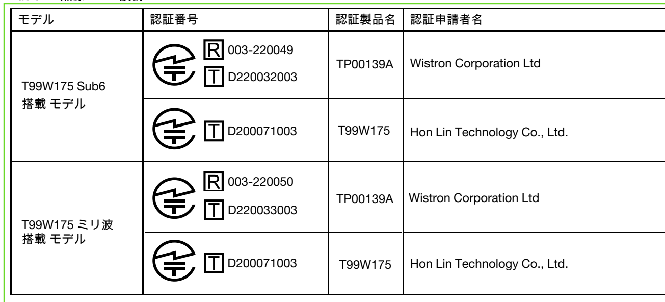
Table 2. 無線 WAN 設備