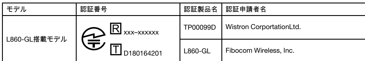
Table 3. 無線 WAN 設備

本製品は、電波法および電気通信事業法により技術基準認証を下記のとおり取得しています。本製品に組み込まれた無線設備を他の機器で使用する場合は、当該機器が上記と同じく認証を受けていることをご確認ください。認証されていない機器での使用は、電波法の規定により認められていません。