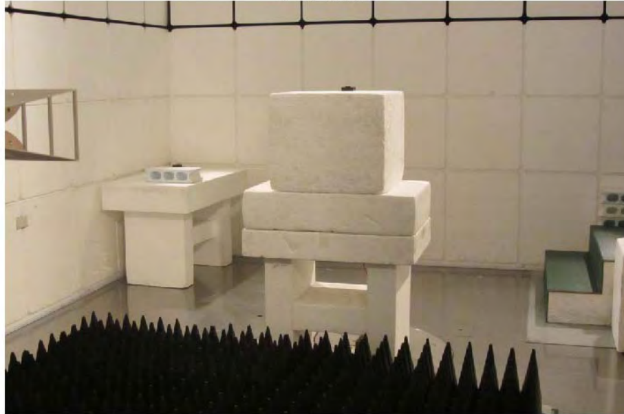
1 - 15 GHz