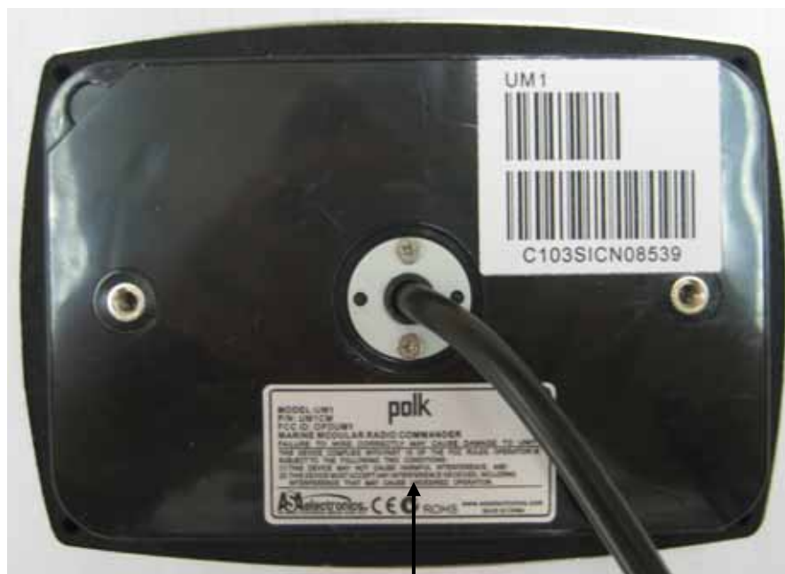
Model label- Commander