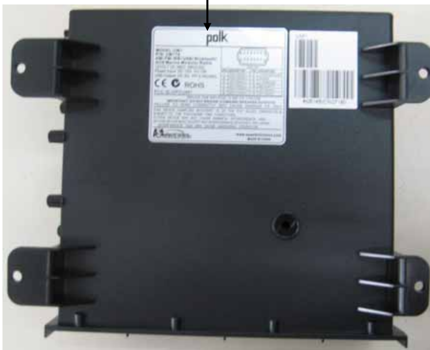
Model label (Main Unit)