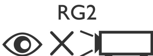
Figure 1: IEC 62471-5:2015