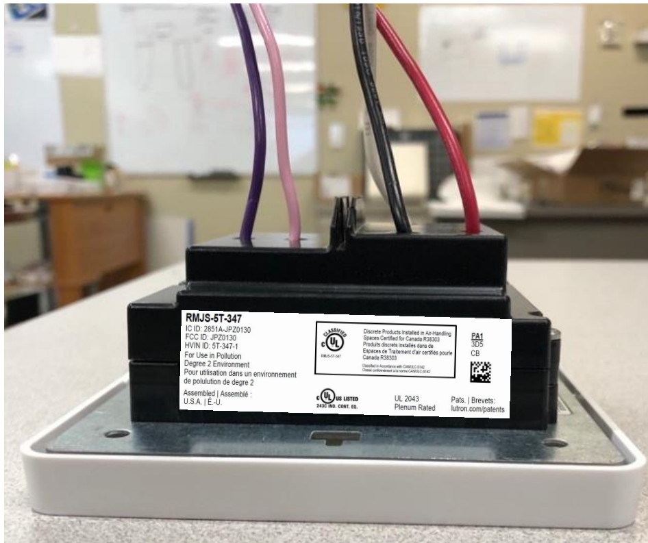
Right Side with Label Location