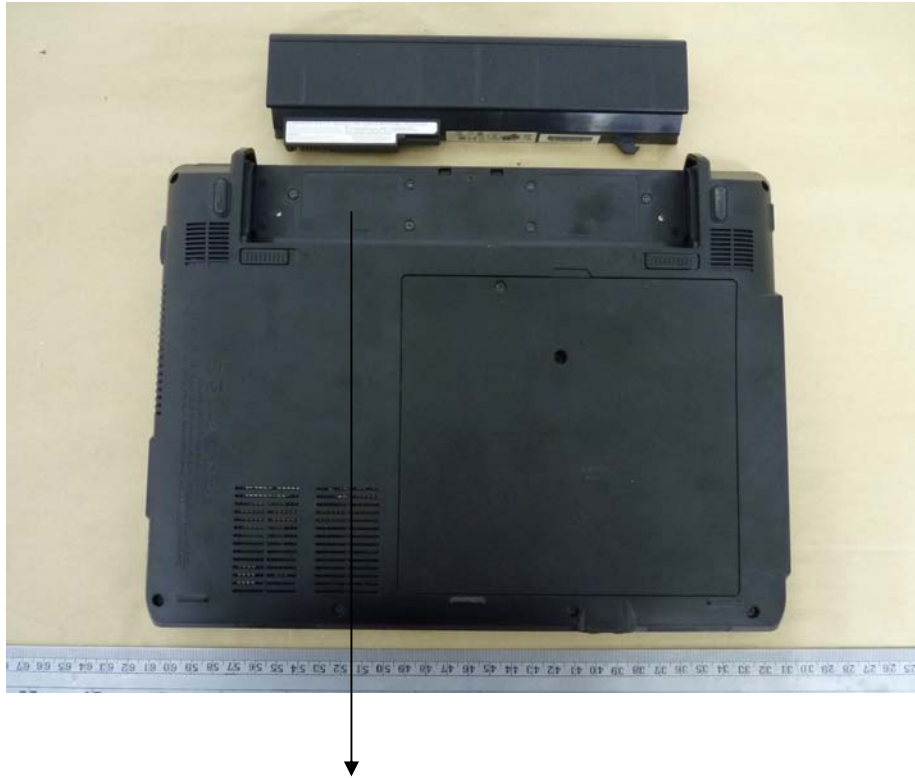
■ T1125 Rating Label V2.0