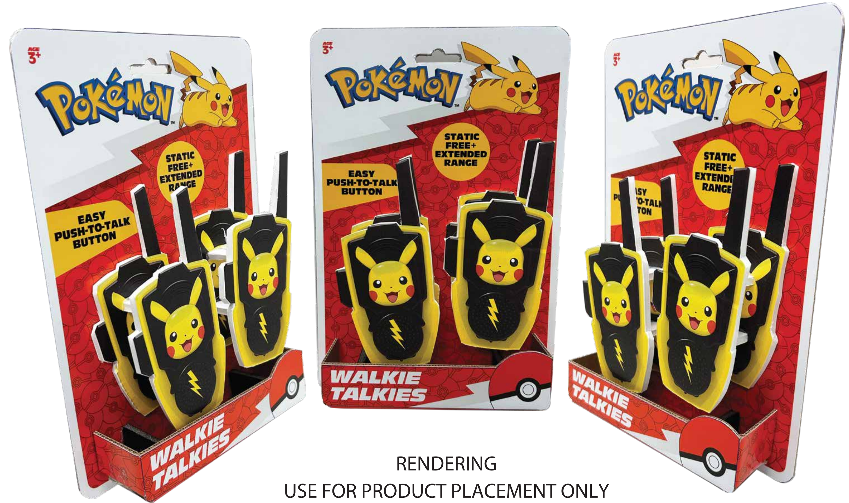
RENDERING USE FOR PRODUCT PLACEMENT ONLY