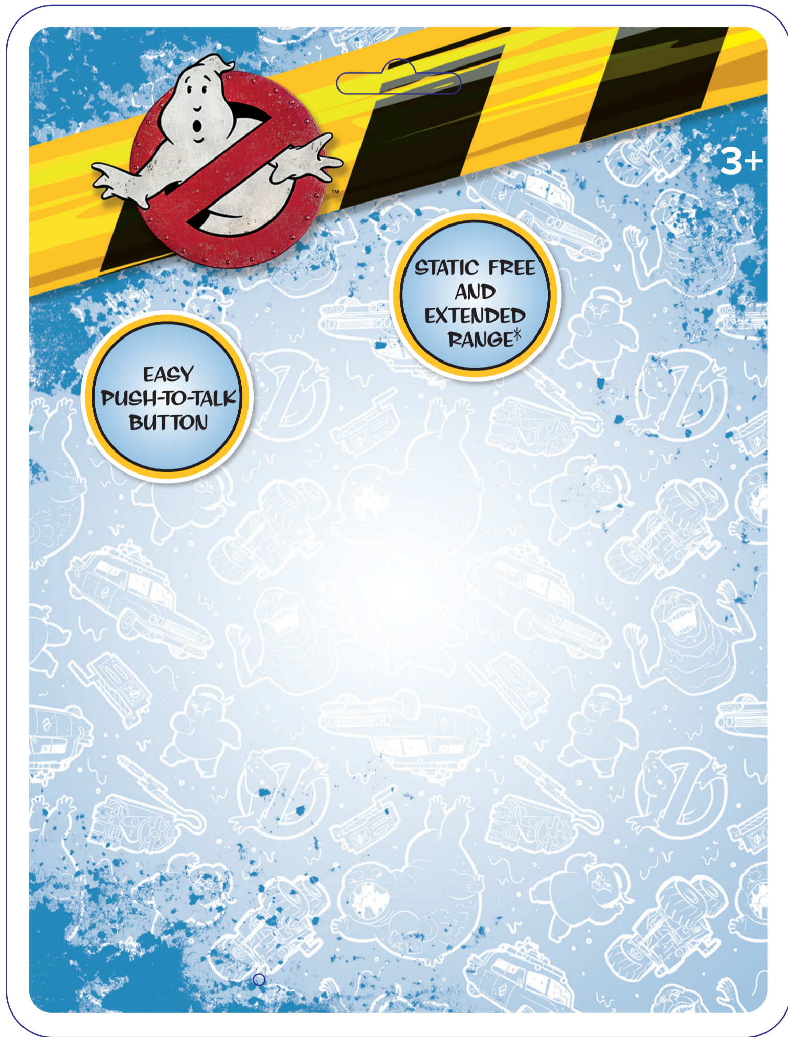
PVC Sheet Front