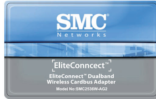
65*40.5mm 1.5R (文字转曲)