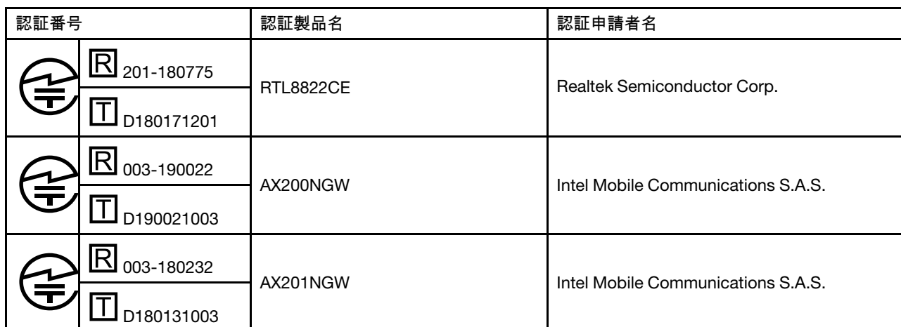
Table 1. 無線LAN / Bluetooth アダプターが搭載されているモデル

本製品が装備する無線アダプターは、電波法および電気通信事業法により技術基準認証を下記のとおり取得しています。本製品に組み込まれた無線設備を他の機器で使用する場合は、当該機器が上記と同じく認証を受けていることをご確認ください。認証されていない機器での使用は、電波法の規定により認められていません。