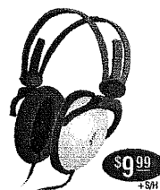
HP-HF-620 Stylish pro headphones. $9.99 +SH