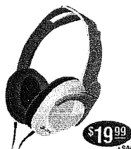
HP-VS980 Features variable vibrating subwoofer. $19.99 +SH

Add new dimension to your music with these pro-quality headphones! All three models feature: • collapsible design • attractive carrying pouch • dual plug adapter.