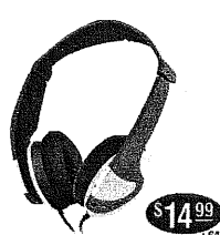
HP-SRS-3 Features variable SRS-3 surround sound. $14.99 +SH