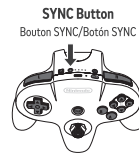
SYNC Button Bouton SYNC/Botón SYNC

Control de Nintendo 64 para la consola Nintendo Switch. Este control es para utilizarse con los juegos de Nintendo 64 - Nintendo Switch Online. Si es tu primera vez utilizando el control, cárgalo y sincronízalo con una consola Nintendo Switch.