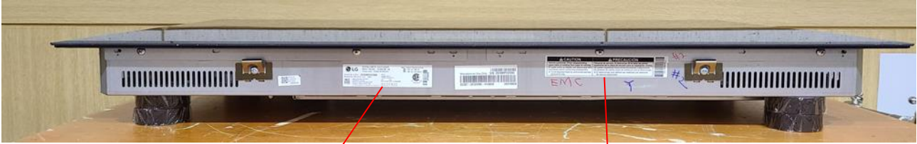
< Front side >