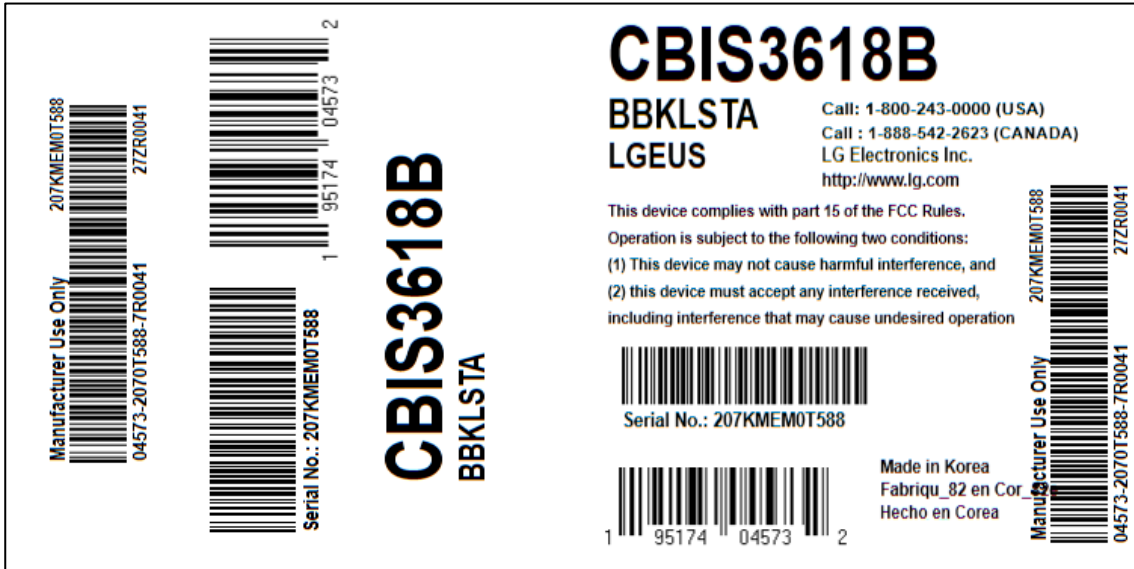
< Box label >