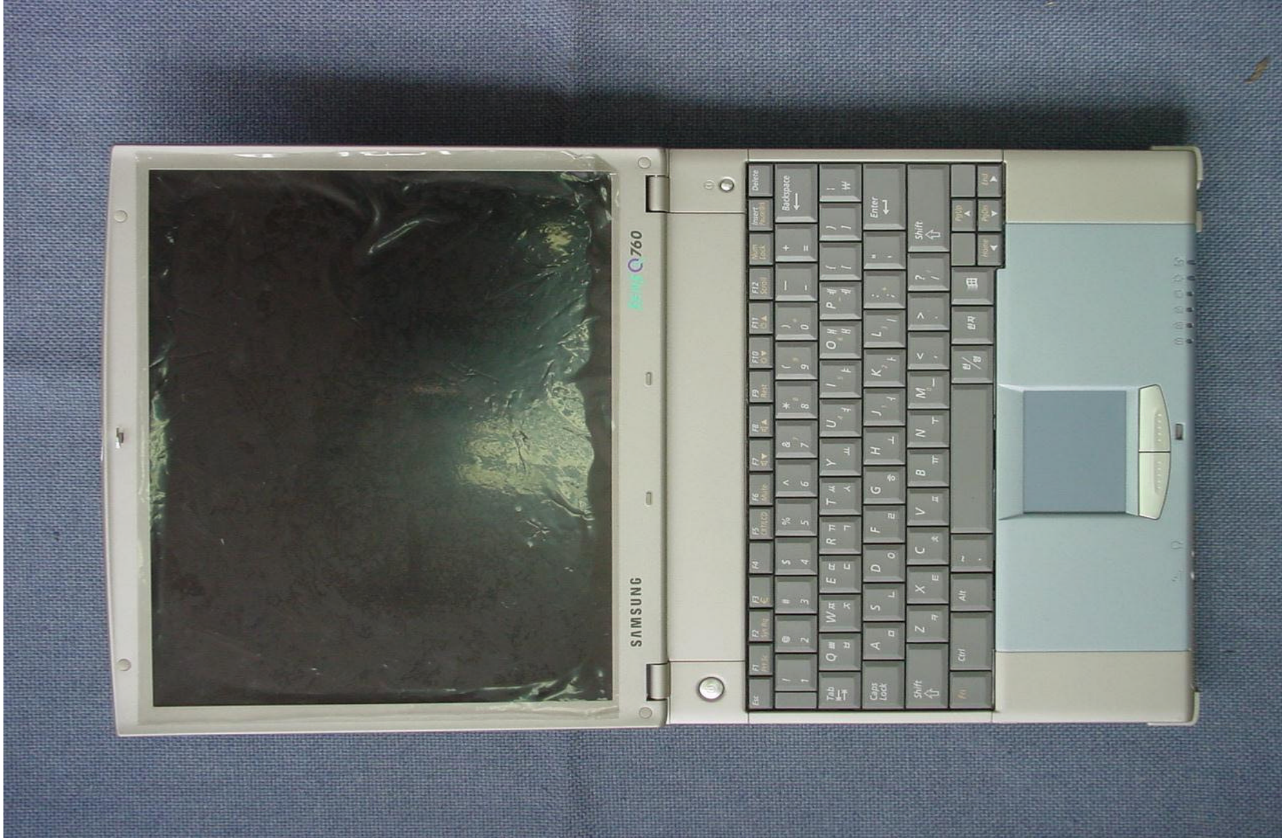
Front side of EUT