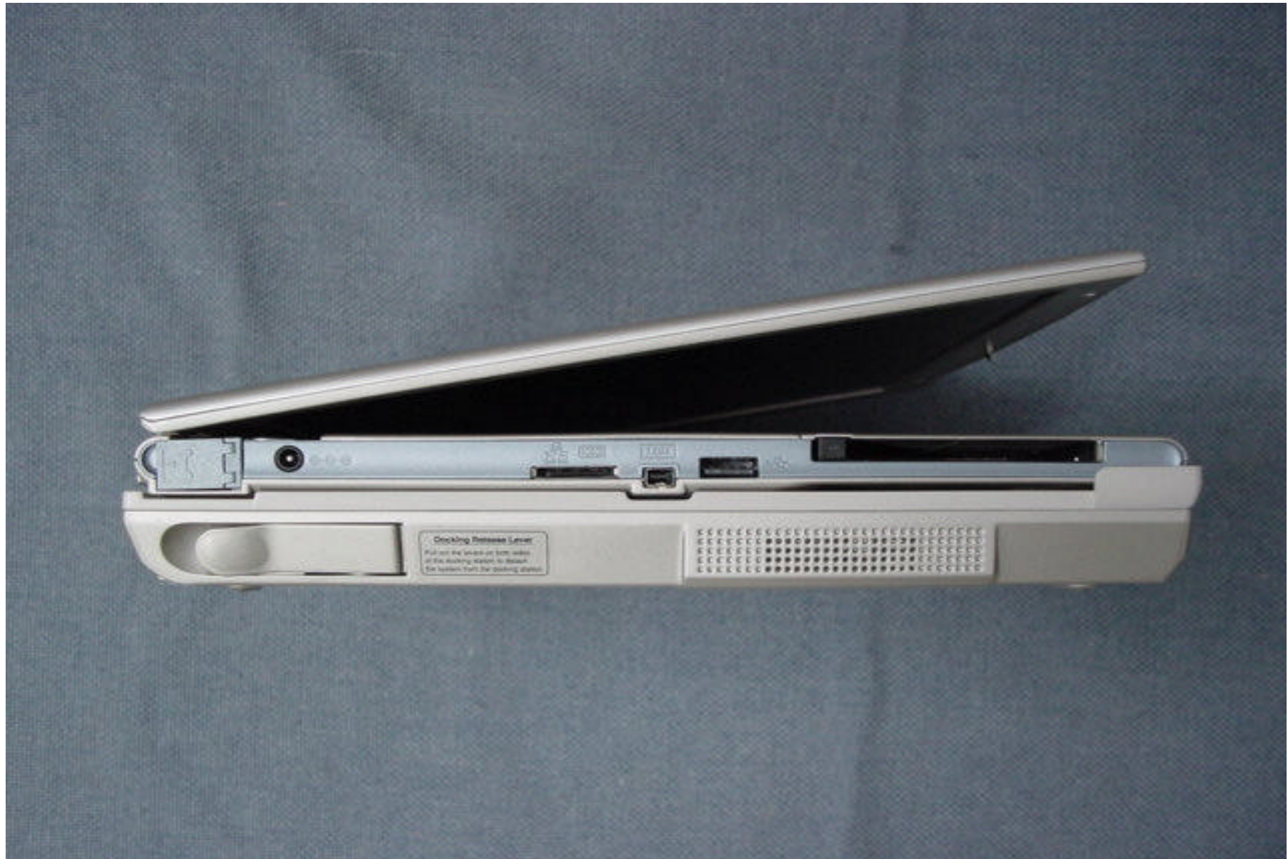
Side of EUT