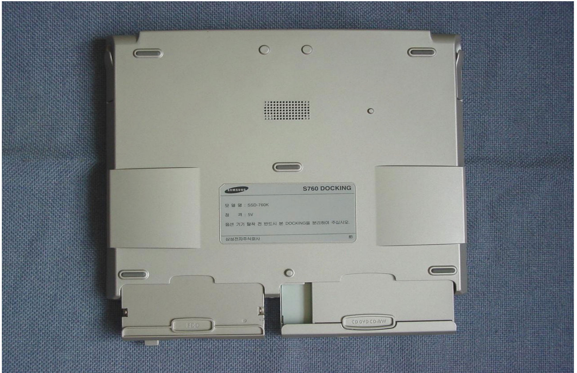
Front side of Docking