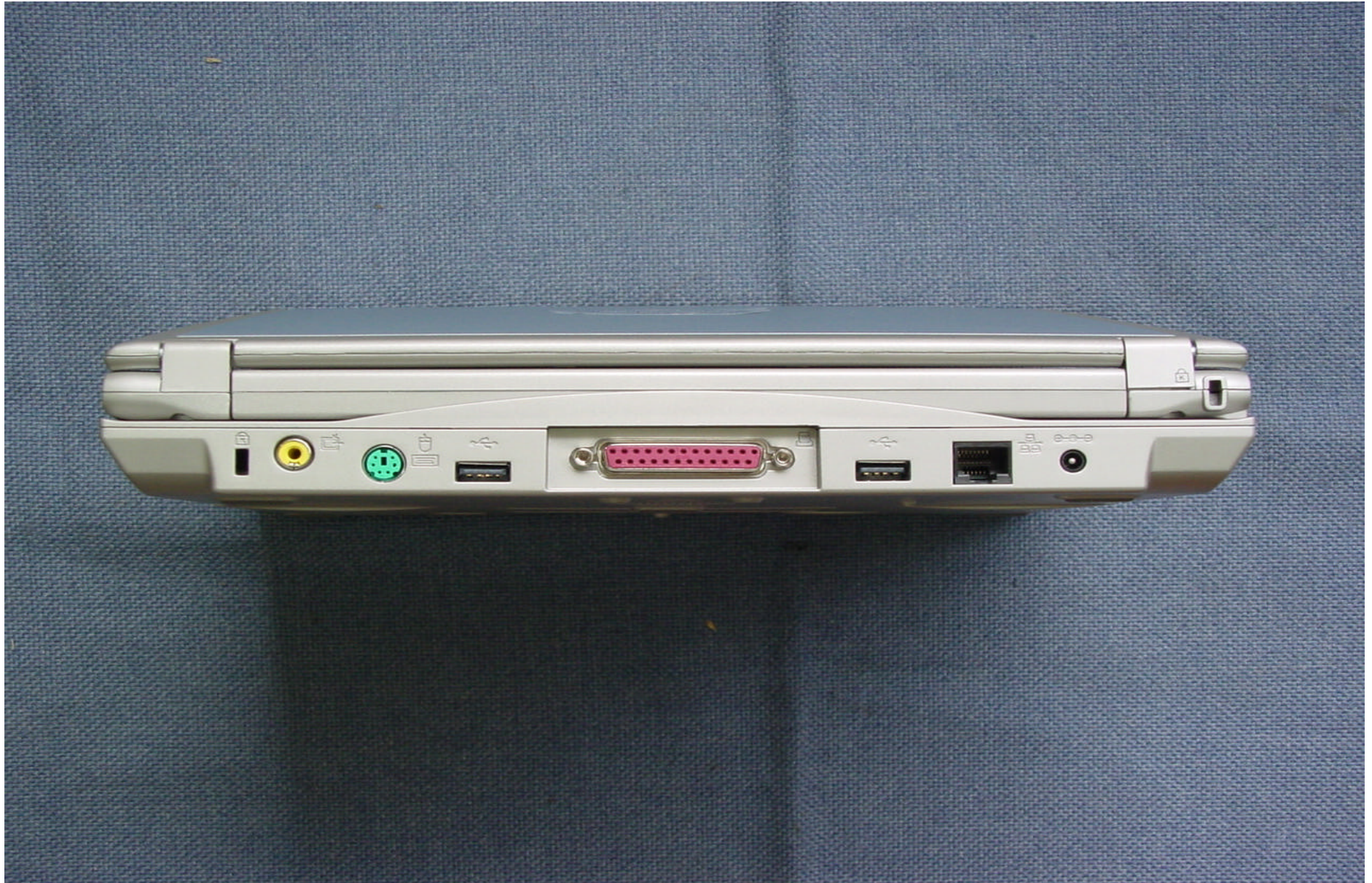
Rear side of EUT