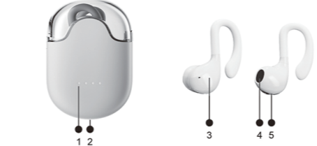
1.ランプです 2.充電口です 3.位置をタッチします 4.音声出力です 5.充電触点です