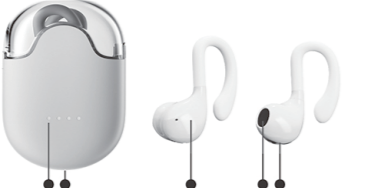
1.指示灯 2.充电口 3.触摸位置 4.音频输出 5.充电触点