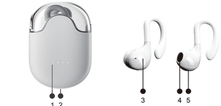
1.Indicator light 2. Charging port 3. Touch the location 4. Audio output 5. Charging contact