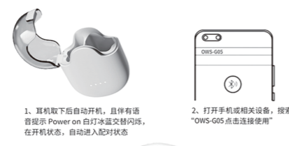
1、耳机取下后自动开机，且伴有语音提示 Power on 白灯冰蓝交替闪烁，在开机状态，自动进入配对状态 2、打开手机或相关设备，搜索“OWS-G05 点击连接使用”