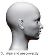
3. Wear and use correctly