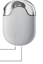
Charge indicator light

Charging state: 1. Charge your headphones Insert the "Type-c" charging cable into the charging port. When the earphone is put into the charging bin and automatically enters the shutdown state, the white light will be on. The indicator in full power state is off. 2. The battery is low When the voltage is low, the white light flashes for 3 times, and the voice prompt signals once every 60 seconds