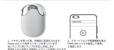
1. イヤホンを取った後、自動的に電源を入れます。Power on という音声メッセージを待っています。白いランプが青いランプが交互に点滅します。電源を入れた状態は、自動的にペアリング状態になります 2. スマートフォンや関連機器を開き、「OWS-G05 リックで接続して使用」と検索します