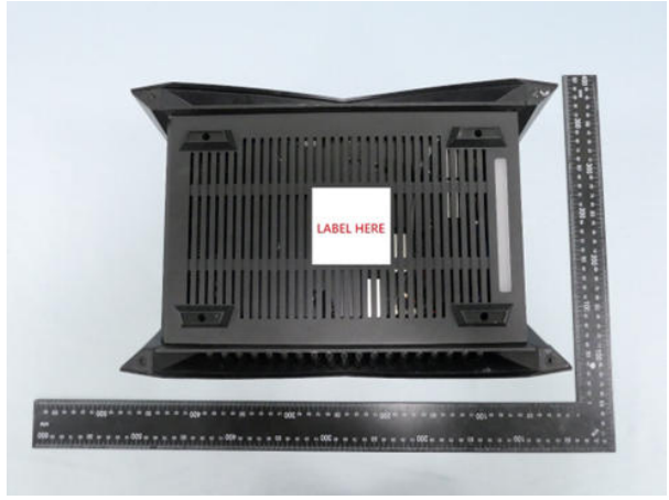
文字转曲 (供应商来料效果)