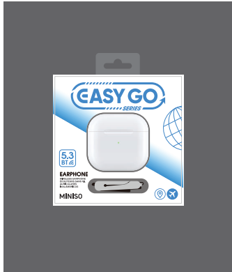
底盖盒 尺寸: 105*105*44mm