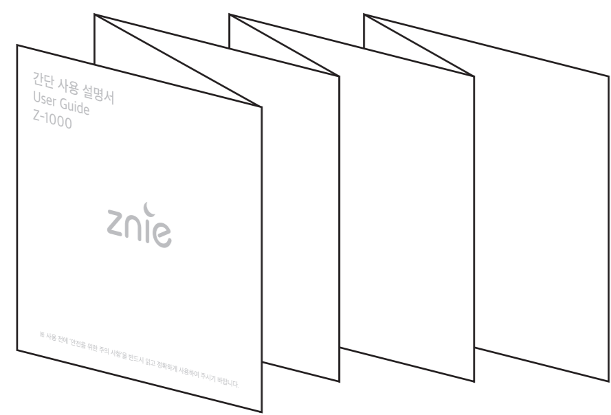
접은 후 앞면