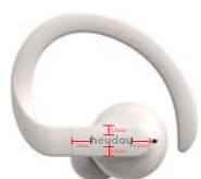
heyday 1.5mm logo丝印, 位置上下居左中