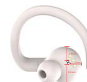
heyday 1.5mm logo丝印, 位置上下居左中