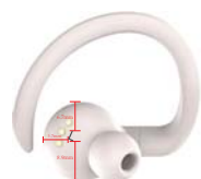
heyday 1.5mm logo丝印, 位置上下居右中