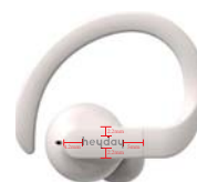
heyday 1.5mm logo丝印, 位置上下居右中