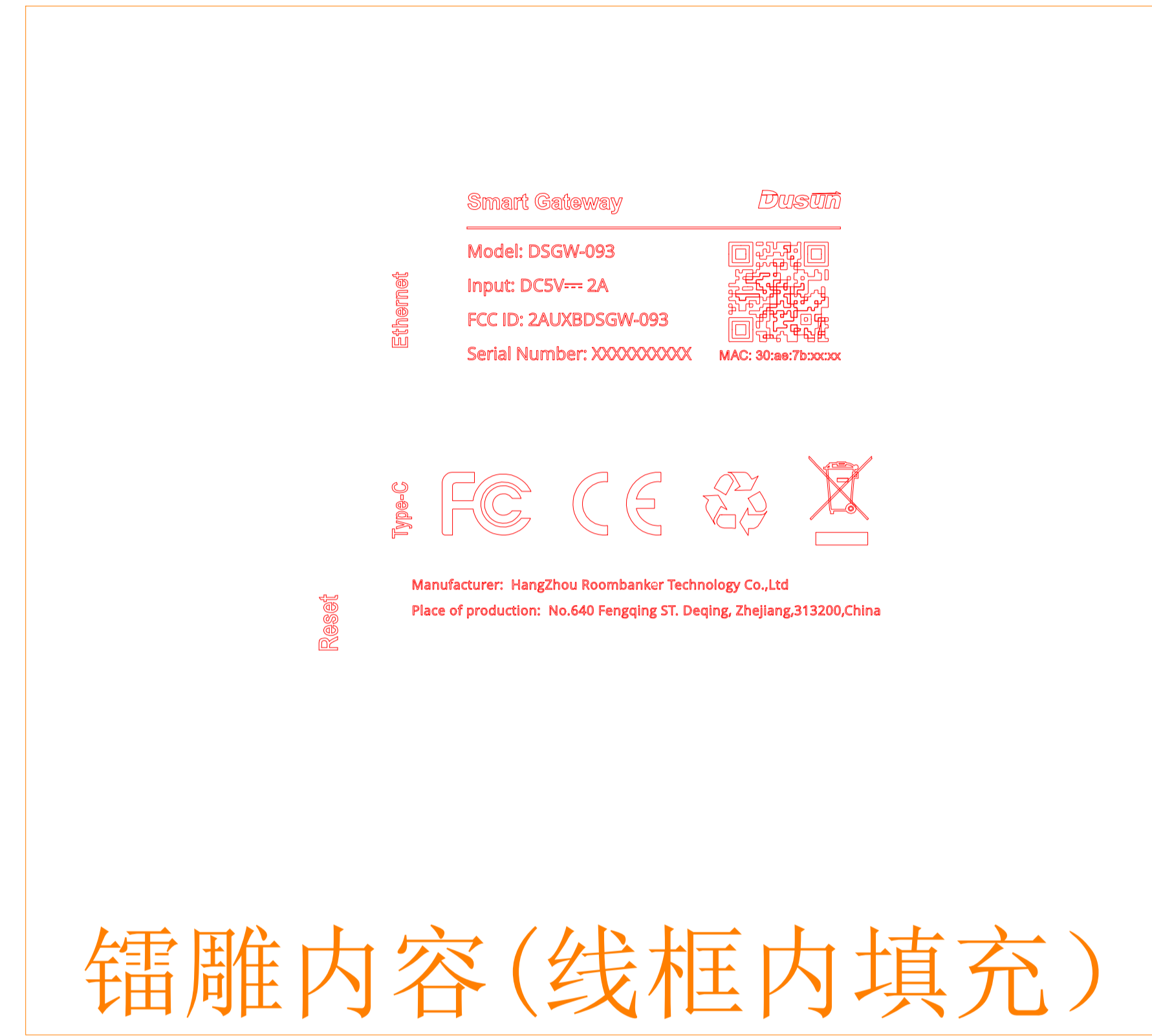
镭雕内容(线框内填充)