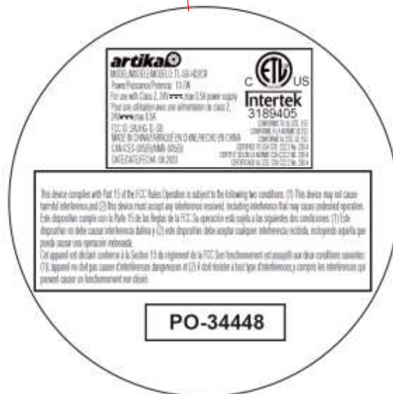
The label is on the bottom of the light fixture.