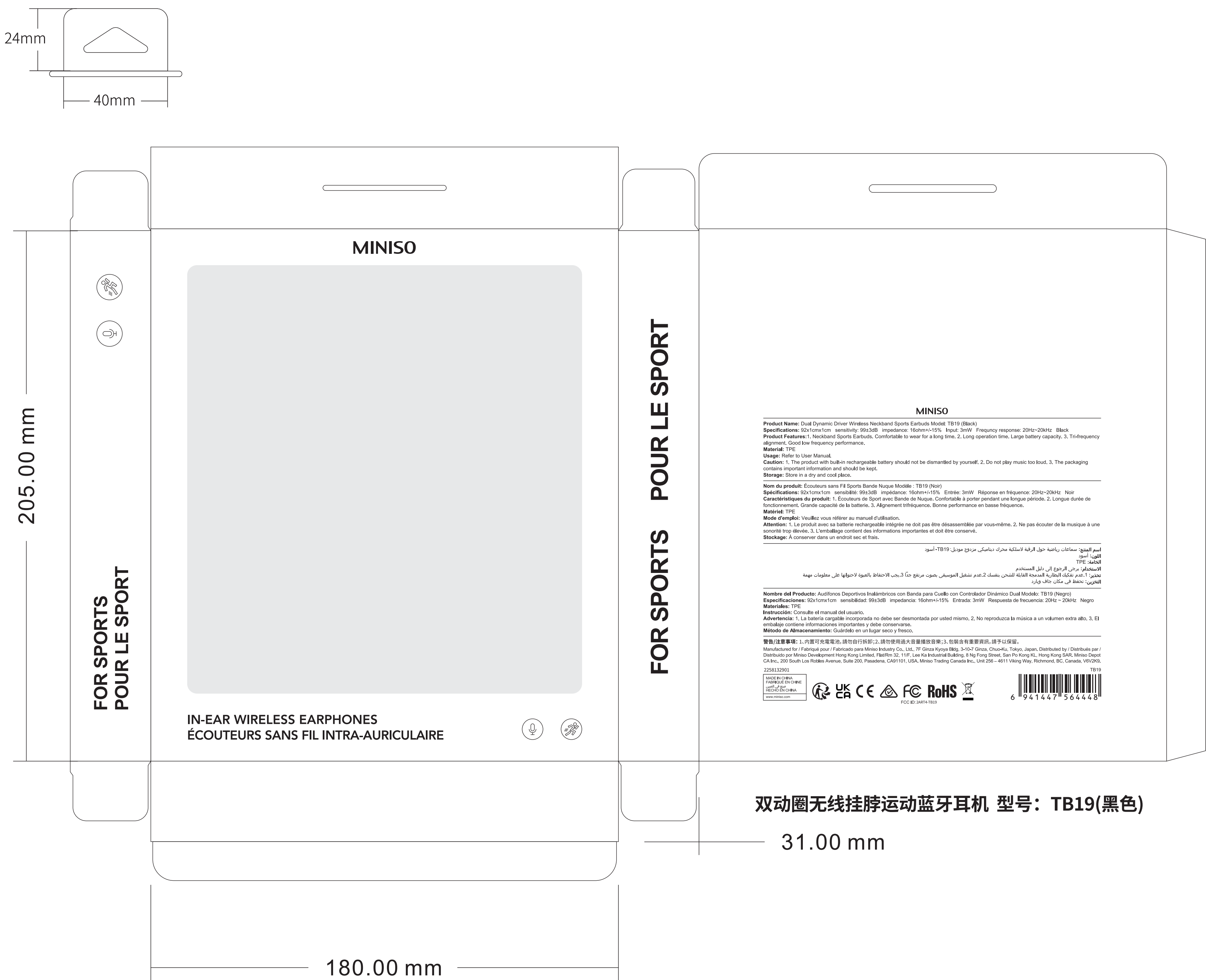
双动圈无线挂脖运动蓝牙耳机 型号: TB19(黑色)