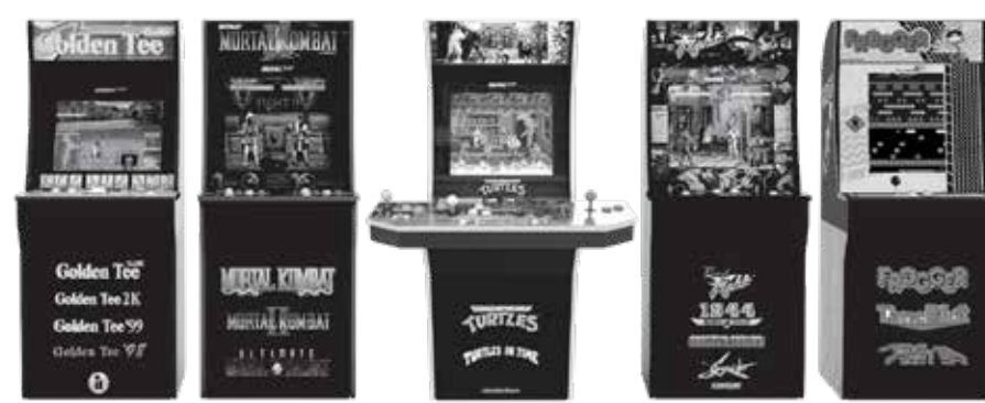
GOLDEN TEE CLASSIC™ GOLDEN TEE™ GOLDEN TEE 99™ GOLDEN TEE 99™ MORTAL KOMBAT™ MORTAL KOMBAT 2™ ULTIMATE MORTAL KOMBAT 3™ TENENGE MUTANT NINJA TURTLES™ TURTLES IN TIME™ FINAL FIGHT™ FINAL FIGHT™ 2™ THE LOOP MASTER™ GHOSTS 'N GOBLINS™ STRIDER™ FROGGER™ TIME PILOT™ TIME PILOT 84™

visit ArcaDe1up.com TO SIGN UP FOR OUR MAILING LIST AND SEE A COMPLETE LIST OF GAMES