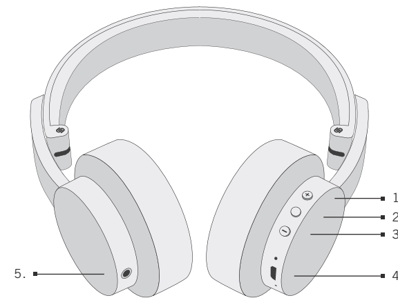
1. (+) 3. (-) 5. Audio jack 2. Multifunction 4. Micro-USB

To charge the headphones, connect the included cable to the micro USB port. Then insert the USB plug to a power outlet or to your computer.