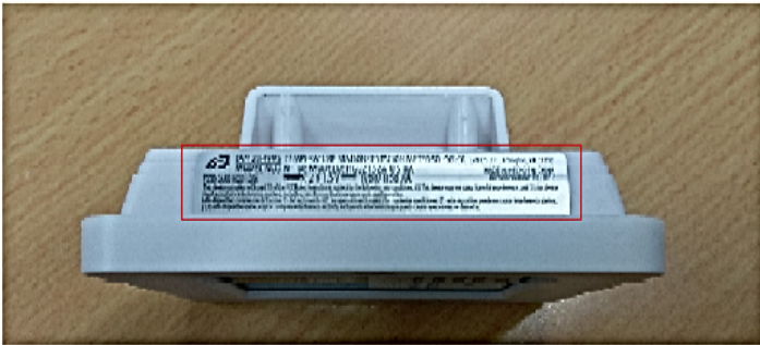
Receiver Bottom side