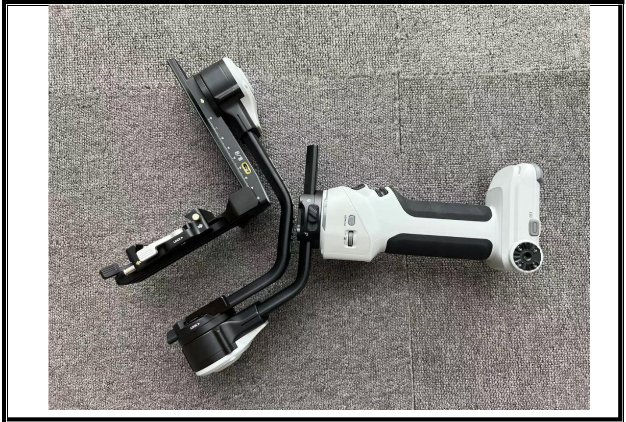
侧面照（含发射口、接口等部位）