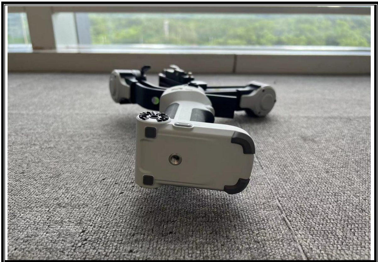
侧面照（含发射口、接口等部位）