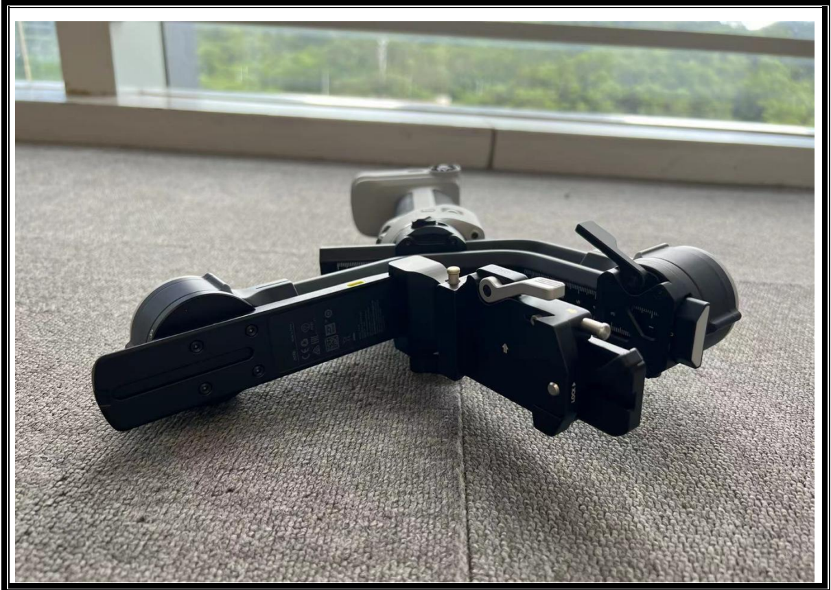
侧面照（含发射口、接口等部位）