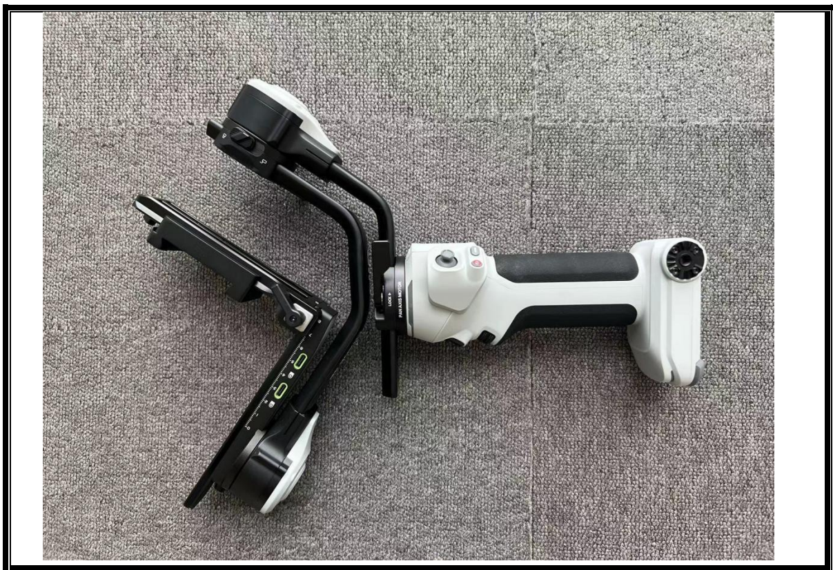
侧面照（含发射口、接口等部位）