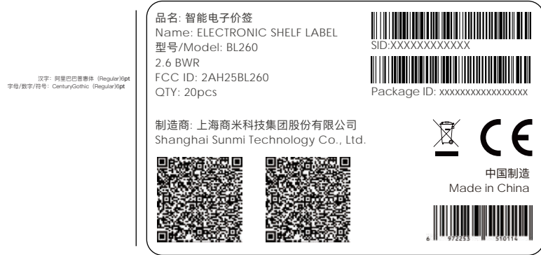
2.6寸常温版 (中规/欧规/美规)