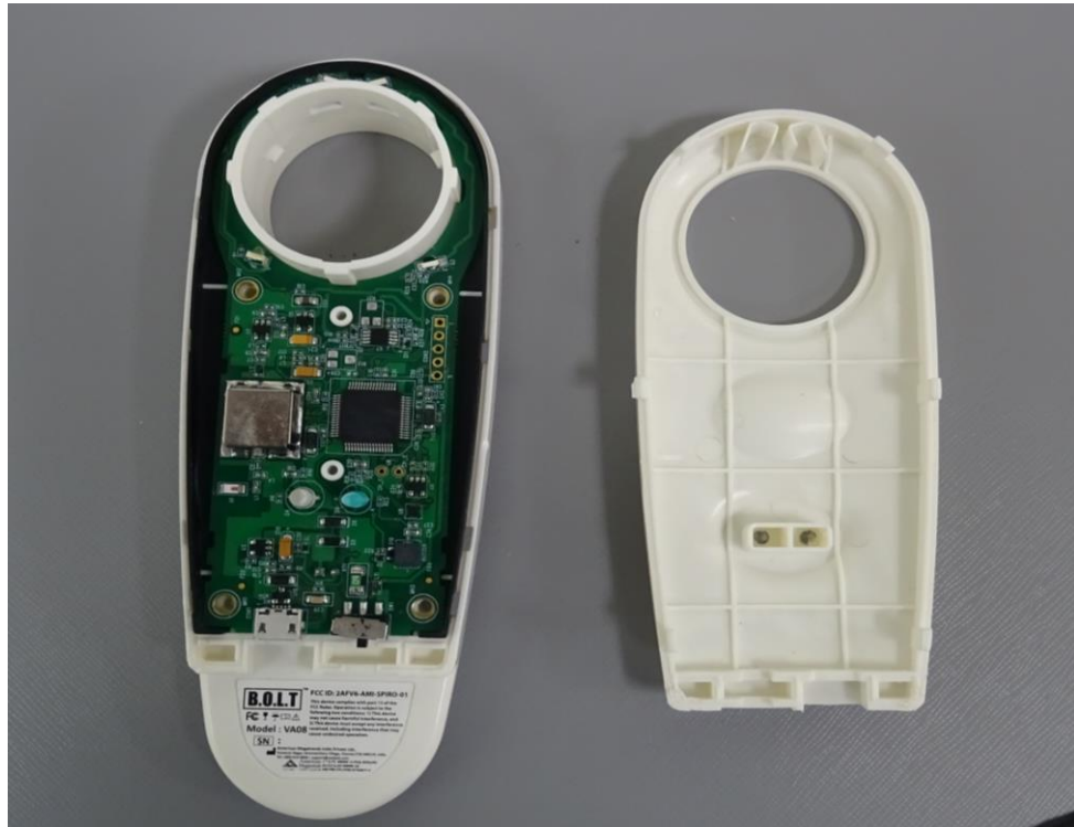
EUT Panel Removed