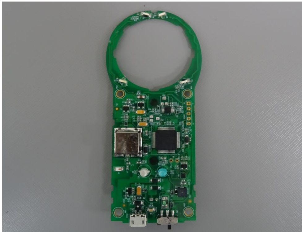
PCB Front View