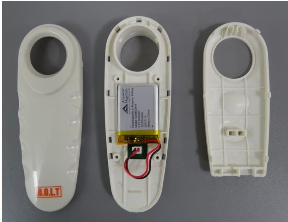
EUT Panel Removed