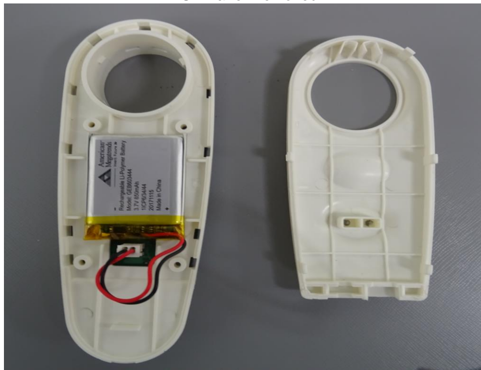
EUT Panel Removed