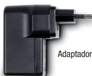
Adaptador de corriente