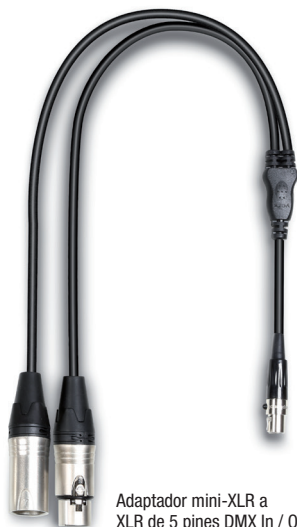
Adaptador mini-XLR a XLR de 5 pines DMX In / Out