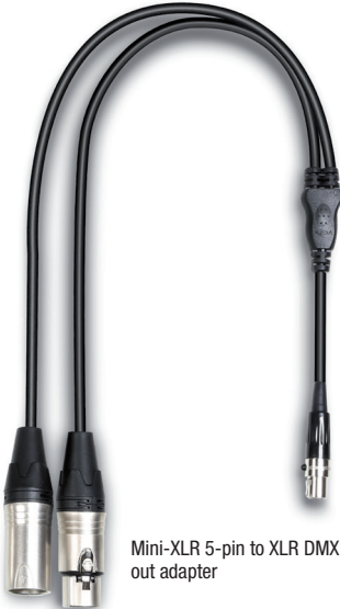
Mini-XLR 5-pin to XLR DMX in/ out adapter