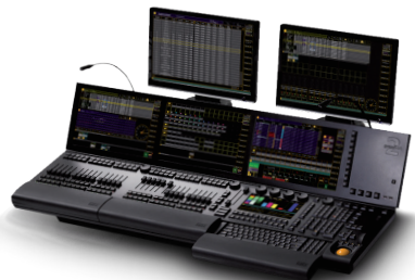
DMX Light Controller