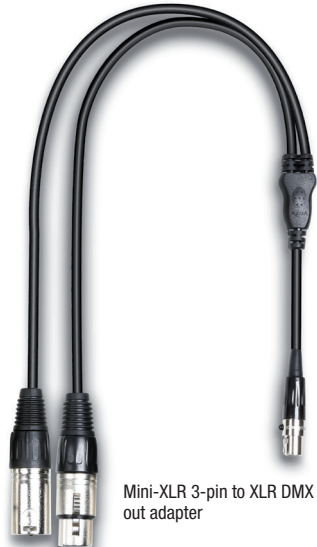
Mini-XLR 3-pin to XLR DMX in/ out adapter