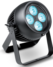
Any W-DMX™ Fixture (i.e. CAMEO ZENIT B60)