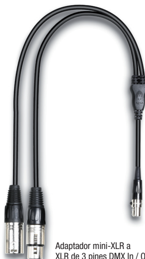
Adaptador mini-XLR a XLR de 3 pines DMX In / Out