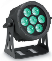
Other DMX Fixtures (i.e. CAMEO FLAT PRO 7)