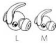
Eartips (2 pairs)