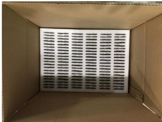
图 3: 放入包装箱, 每箱放置 10 层