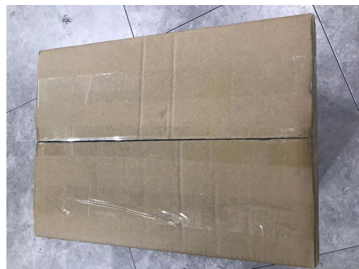
图 4: 封箱, 用透明胶封箱