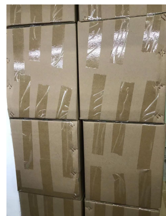
图 6: 物料堆放, 整齐, 标签往外方便寻找物料