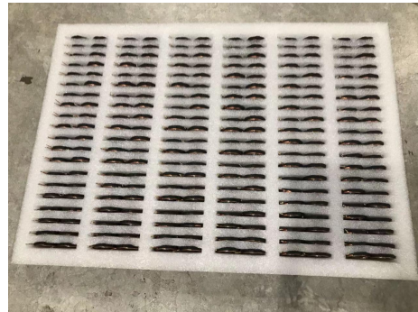
图 2: 统一方向线头朝上整齐排放入盘中