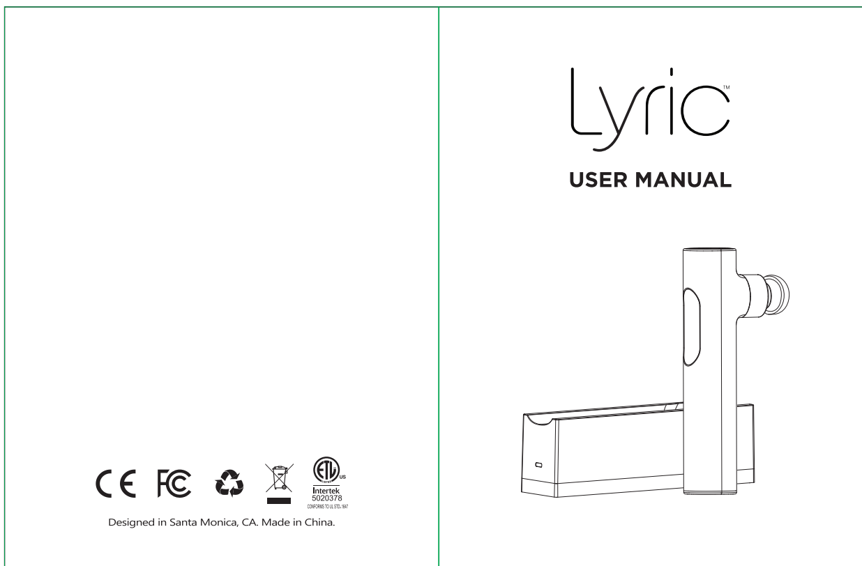
说明书成品尺寸：108*140MM 材质：128G铜版纸