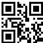
Anzahl der gescannten Barcodes ausgeben (nur im Inventurmodus)