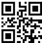
Ripristina le impostazioni di fabbrica