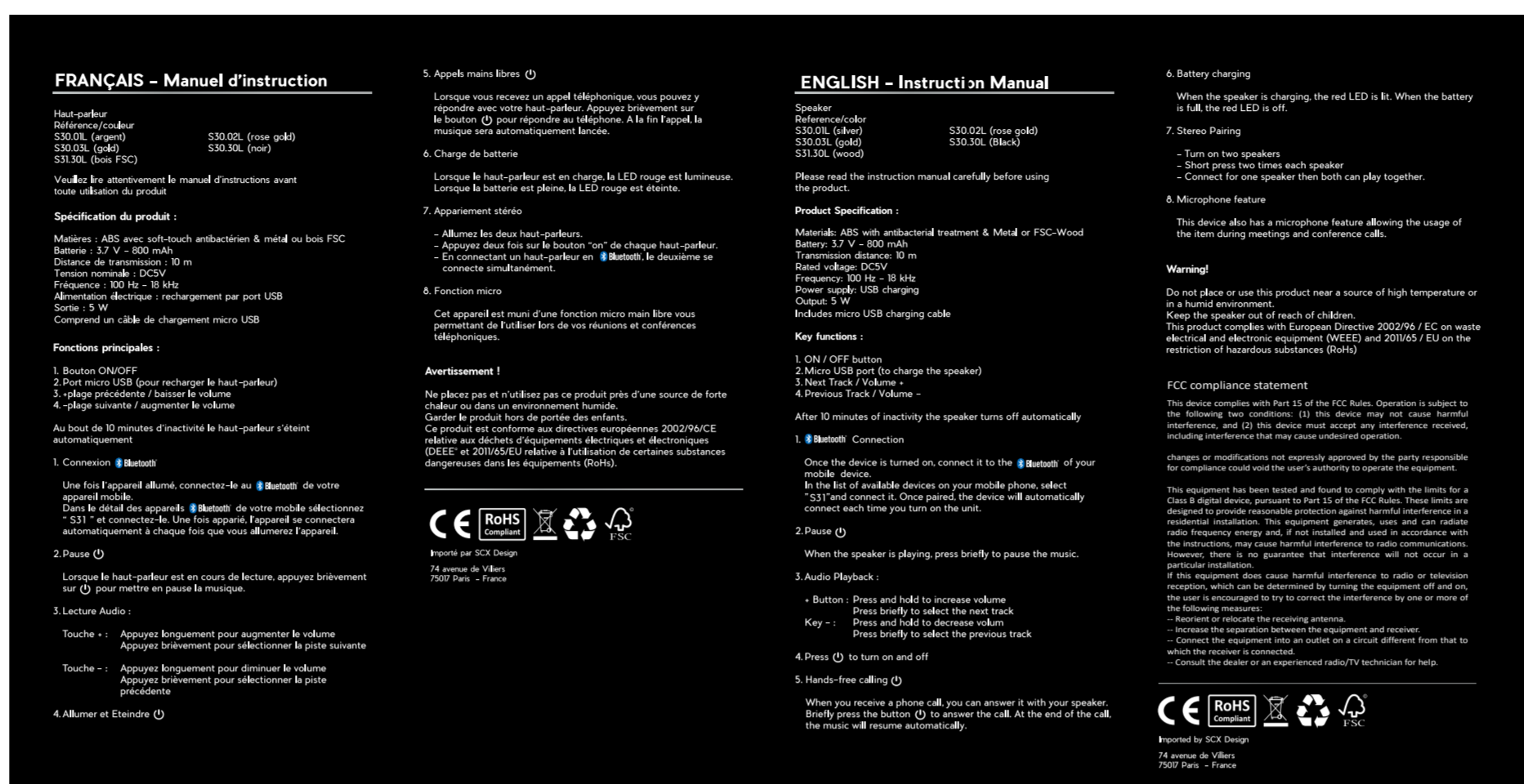
背面 材质:105g双铜,对折