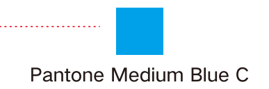
Pantone Medium Blue C