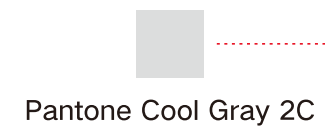
Pantone Cool Gray 2C